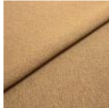
Kangas Jazz CS 15 Terra 9302 1013715