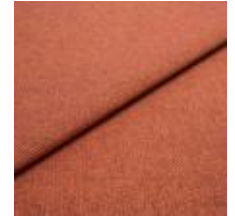
Kangas Jazz CS 21 Brick 9407 1013721