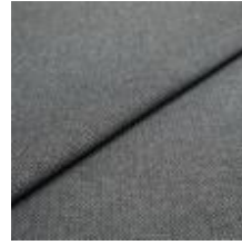
Kangas Jazz CS 7 Stone 9803 1013707