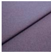
Kangas Jazz CS 71 Violet 9410 1013771