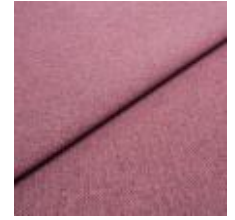
Kangas Jazz CS 11 Pink 9501 1013711