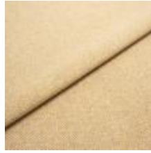
Kangas Jazz CS 5 Wheat 9114 1013705