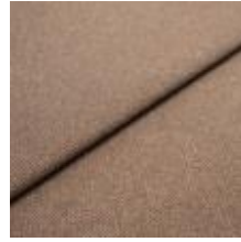
Kangas Jazz CS 6 Cinnamon 9207 1013706