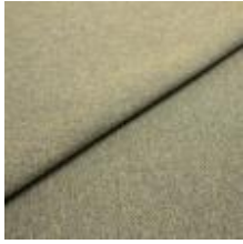
Kangas Jazz CS 13 Light green 9706 1013713