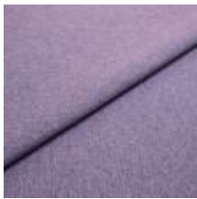
Kangas Jazz CS 51 9504 Lavender 1013751