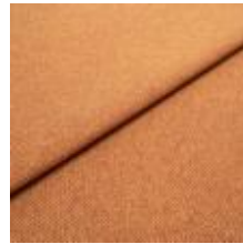
Kangas Jazz CS 31 Orange 9404 1013731