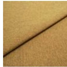
Kangas Jazz CS 33 Olive 9701 1013733