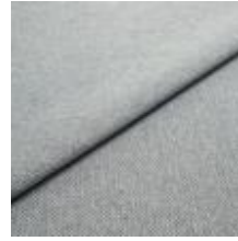
Kangas Jazz CS 17 Steel 9805 1013717