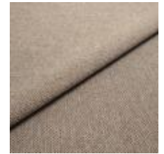
Kangas Jazz CS 36 Brown melange 9208 1013736