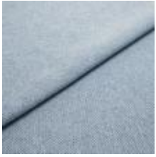
Kangas Jazz CS 12 Ice 9604 1013712