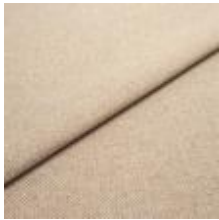
Kangas Jazz CS 26 Beige 9108 1013726