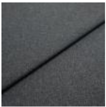
Kangas Jazz CS 47 Night 9804 1013747