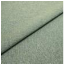
Kangas Jazz CS 23 Cool green 9705 1013723