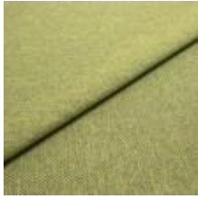
Kangas Jazz CS 3 Green 9703 1013703